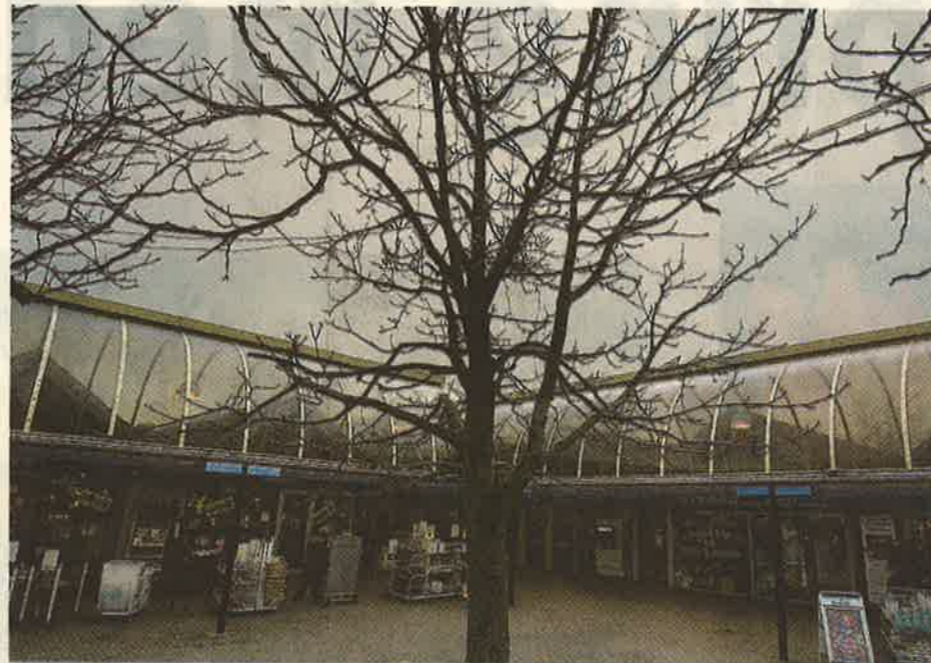
Nivå Center ligger i umiddelbar nærhed af Nivå Station, skole og NKK Hallen og idrætsanlæg. Nivå Center er centrum i Nivå, hvor også posthuset og biblioteket ligger. Centret har mange butikker og dækker fint behovet for alle dagligvareindkøb.