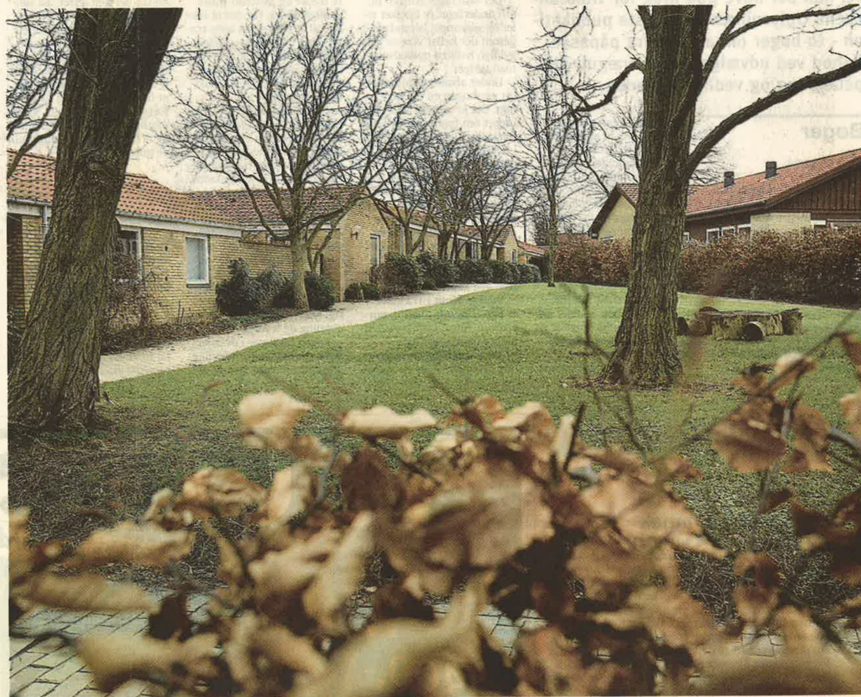
Bebyggelsen i Åtoften er inspireret af kashbaerne, en arabisk byggestil i Nordafrika. Åtoften består af ca. 130 gårdhuse med et udbygget stisystem, hvor børn kan færdes helt uden at blive generet af kørende biler. Da Åtoften blev bygget omkring 1970 var ca. en fjerdedel af beboerne arkitekter.

»I de første år var en fjerdedel af husene beboet af arkitekter. Denne tætte, lave bebyggelse – inspireret af den nordafrikanske Kashba-bebyggelse – var en af de første bebyggelser af sin art i Danmark. Den lave bebyggelse i tætte enheder med pri-